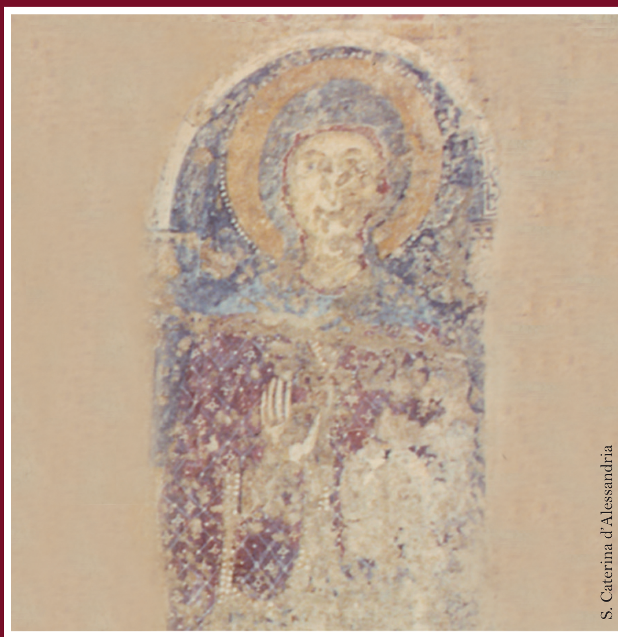
S. Caterina d'Alessandria

Arte Bizantina negli Eremi di Gravina Edizione 2013